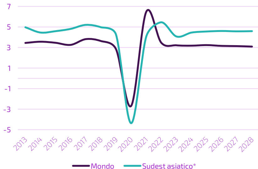
Crescita del Pil sudest asiatico vs. mondo (valori costanti; var. % annua)