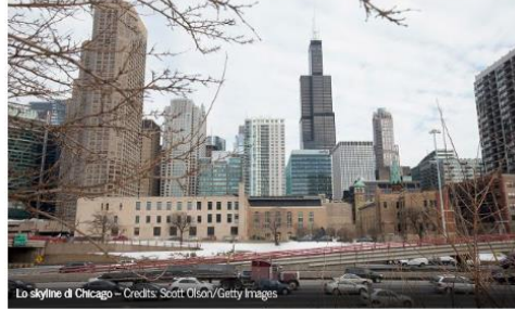
Lo skyline di Chicago

Il Gruppo Giovani Imprenditori è pronto per una missione per costruire nuove opportunità di business con le aziende americane